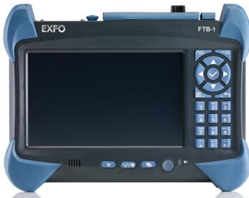
Рисунок 1 – Внешний вид системы измерительной FTB-1